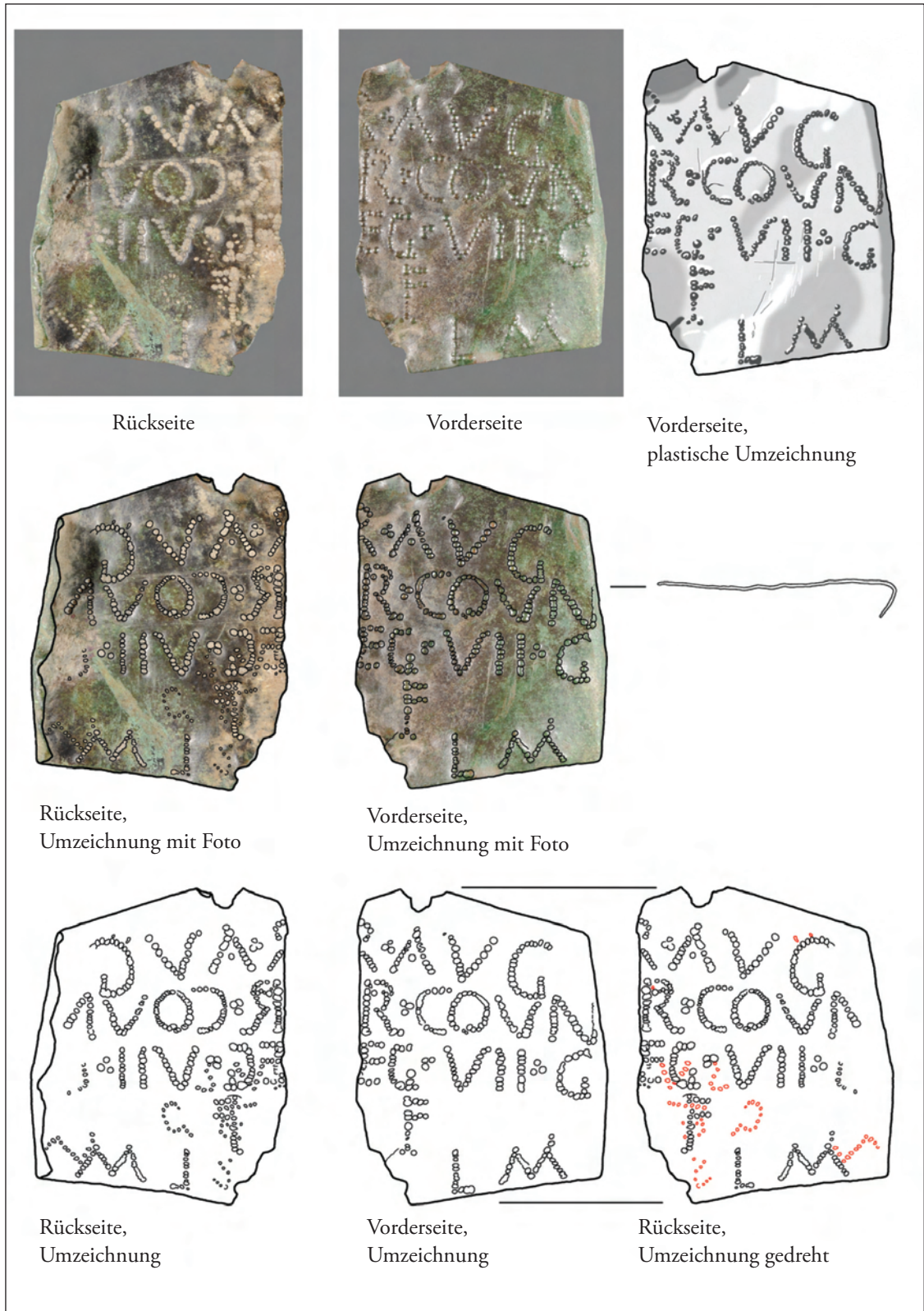
Abb. 1. Weihinschrift aus St. Michael am Zollfeld; Vorder- und Rückseite in Fotografien, Umzeichnungen und Kombination von beiden, Maßstab 1 : 1 (J. Kraschitzer, © Univ. Graz).