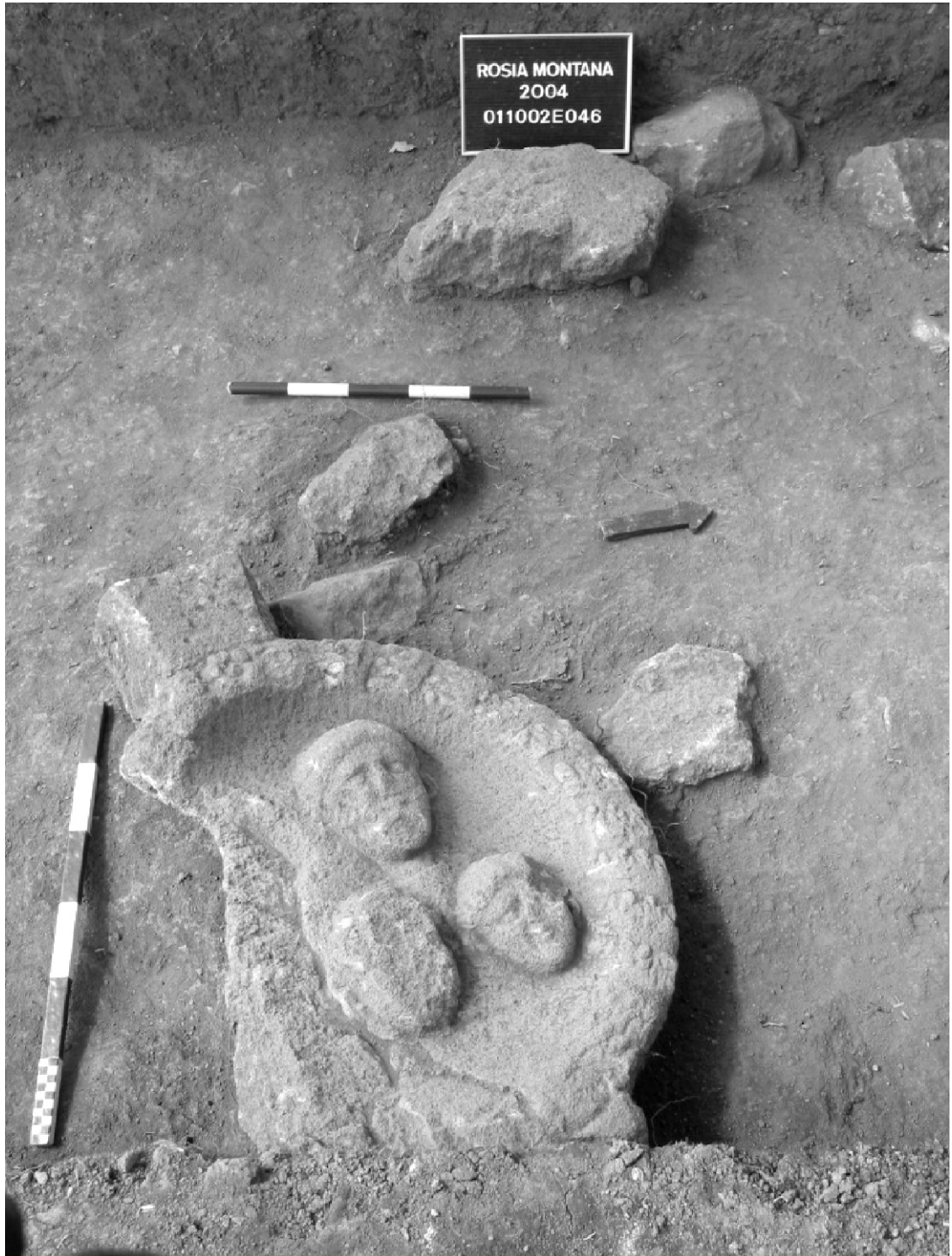
Fig. 3. Medalionul funerar în momentul descoperirii. Abb. 3. Das Freistehende Rundmedaillon bei der Entdeckung.