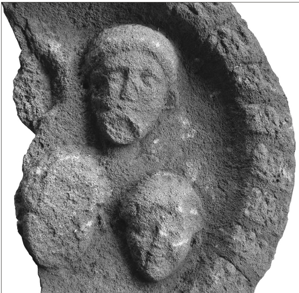
Fig. 1 b. Detaliu medalion funerar, depozit Roșia Montană. Abb. 1 b. Einblick des freistehenden Rundmedaillons Roșia Montană.