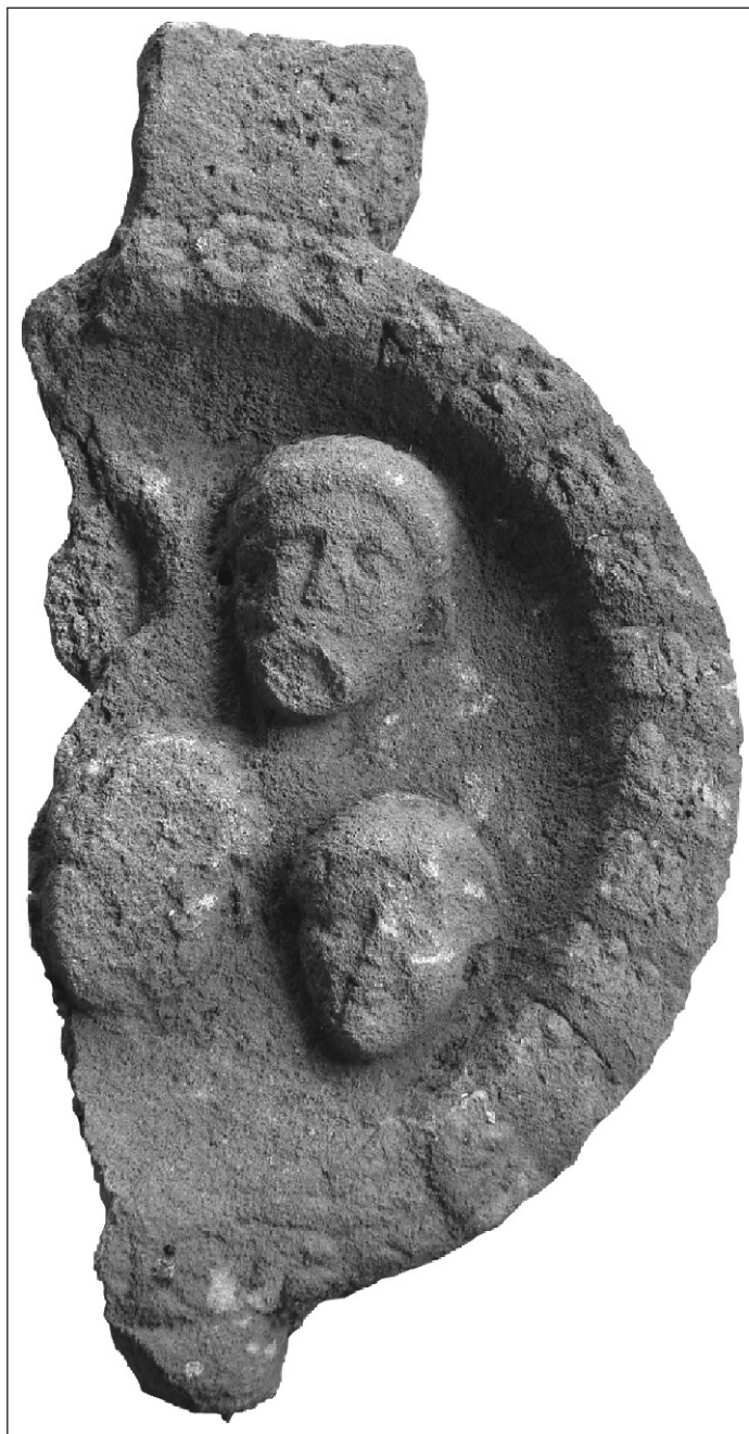
Fig. 1 a. Medalionul funerar, depozit Roșia Montană. Abb. 1 a. Freistehendes Rundmedaillon, Roșia Montană.