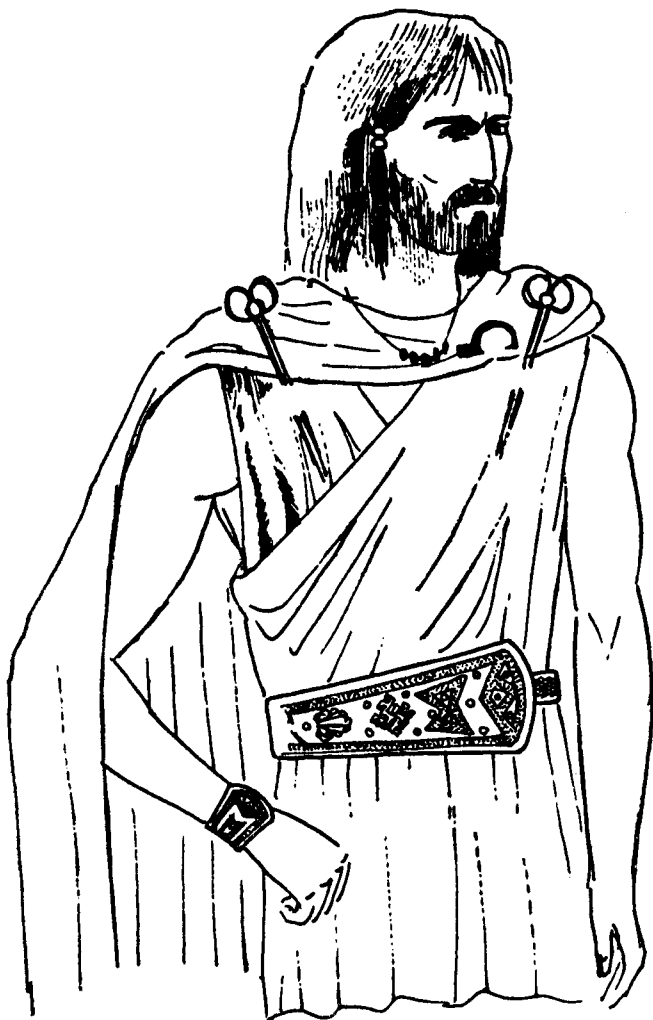
Fig. 2. La ricostituzione del modo di utilizzazione delle cinture di tipo Mramorac.

persone. Gli ornamenti sulle placche d'argento non sono sempre identici: così, invece della palmetta può apparire anche una croce gamata; la palmetta può avere più petali. Generalmente, però, si può parlare di una tecnica e un'atmosfera ornamentale comune per le cinture di tipo Mramorac.