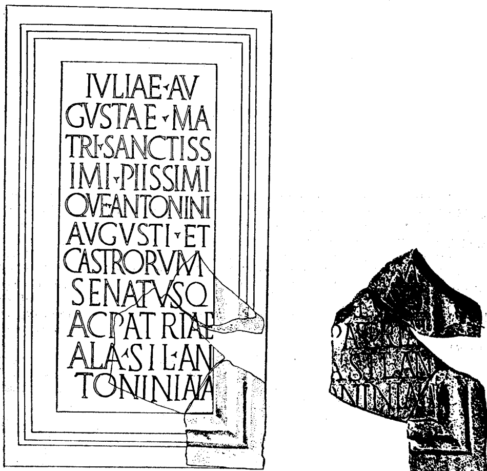
Fig. 1. — a—b. Inscripția de la Gilău.

primul rând păstrat. Cuvântul căruia îi aparține, în acest context, este desigur [ castrorum ], personajul care este onorat în prosopografia imperială cu titulatura de mater castrorum , senatusque ac patriae fiind împărăteasa Iulia Domna. Stabilind acest lucru, ajungem ușor la o analogie epigrafică foarte cunoscută, pe baza căreia este posibilă perfectă completare a întregii inscripții din castrul Gilău. Este vorba despre inscripția în cinstea Iuliei Domna din principia castrului de la Cășeu (jud. Cluj) și publicată de Em. Panaitescu (fig. 2) 4 . Textul acestei inscripții este următorul: Iuliae Augus/tae matri san/c[ti]ss[i]mi piissi/miq[ue] Anto/nini Augusti/ et castrorum / senatusqu[e] / ac patriae / coh(ors) I Brit[a]/nica (milliaria) Ant/oniniana .